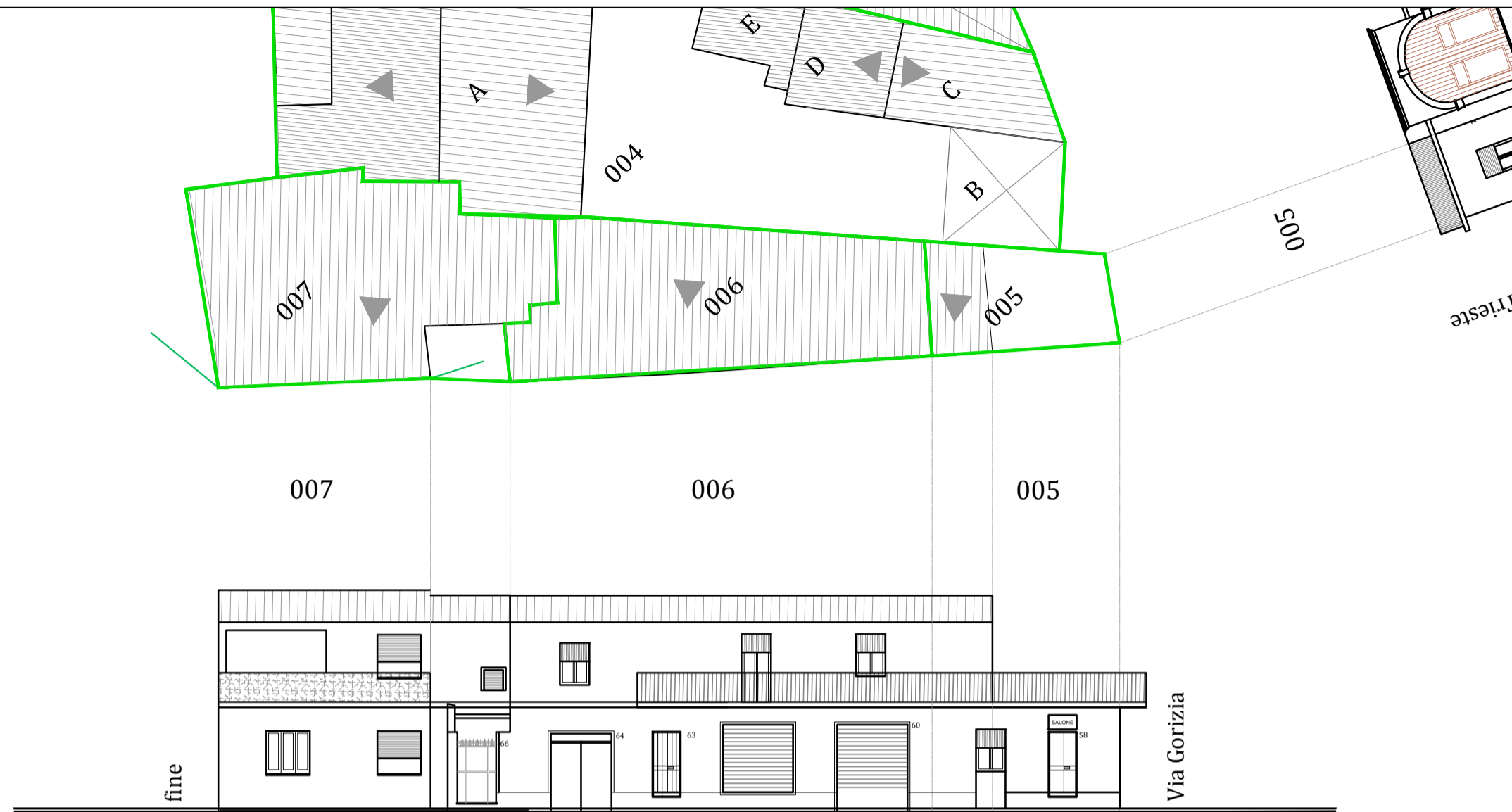
Via Trieste ATTUALE