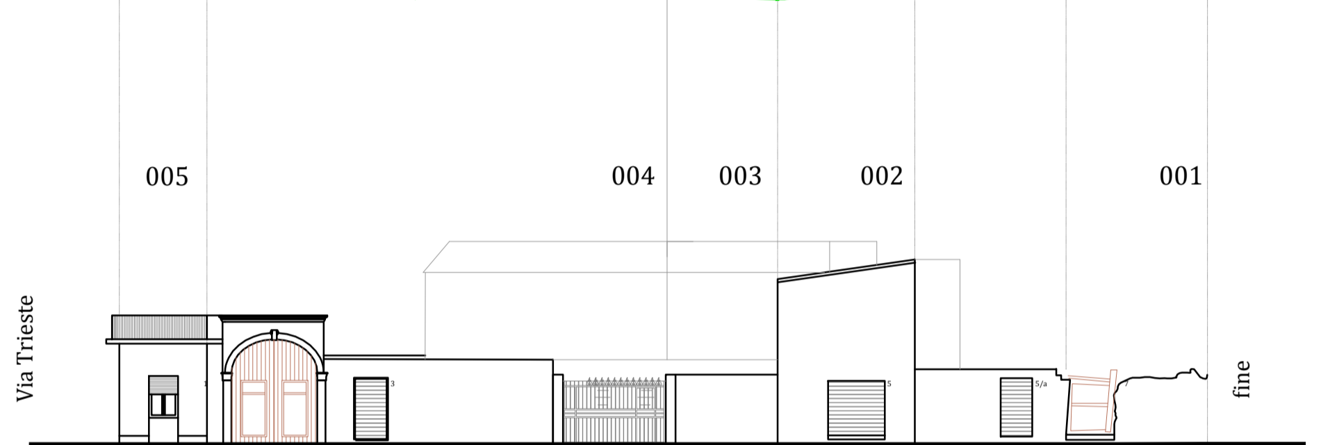
Via Gorizia ATTUALE