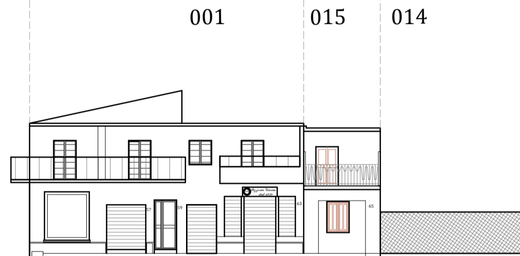
Via Tevere ATTUALE