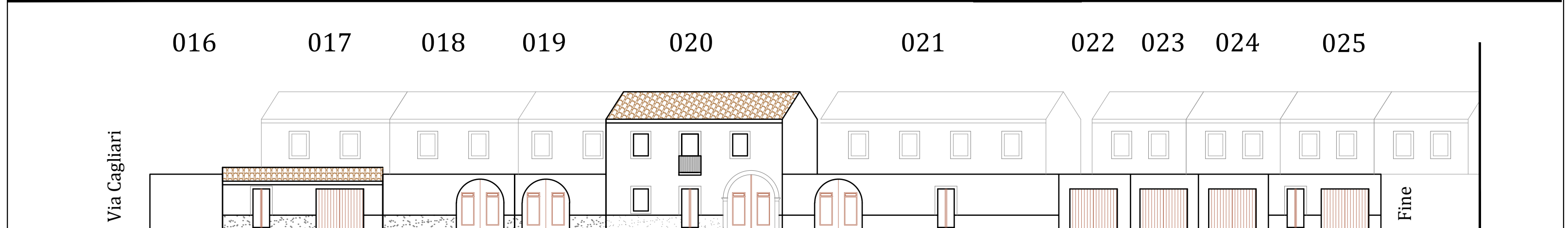
Via Dei Mille PROFILO REGOLATORE