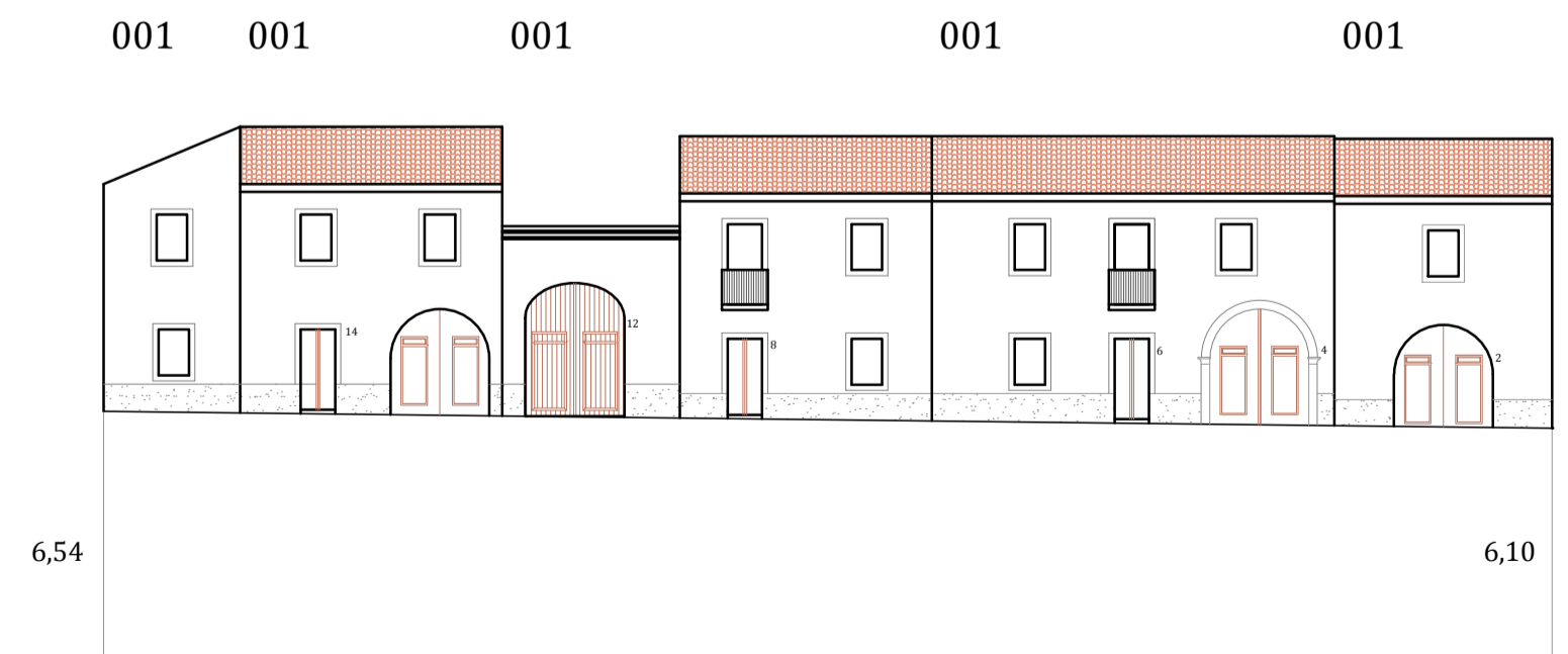
Via Trieste PROFILO REGOLATORE