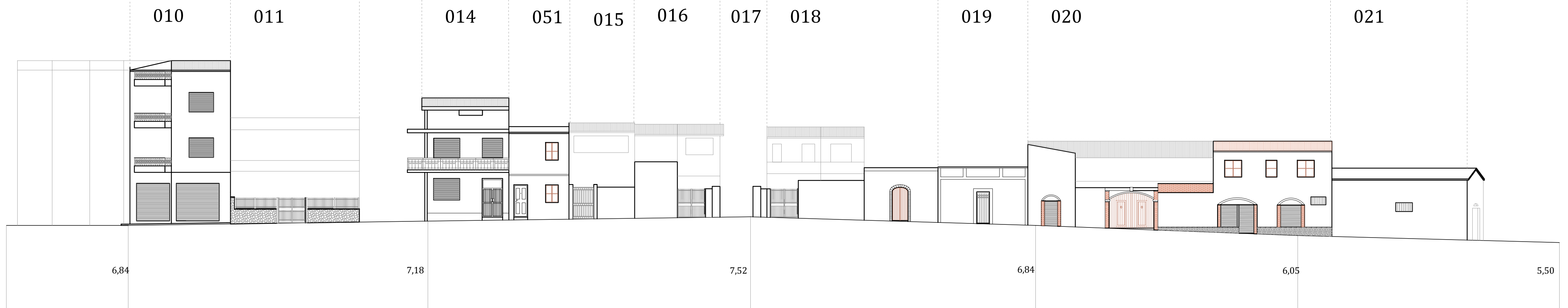
Via XX Settembre ATTUALE