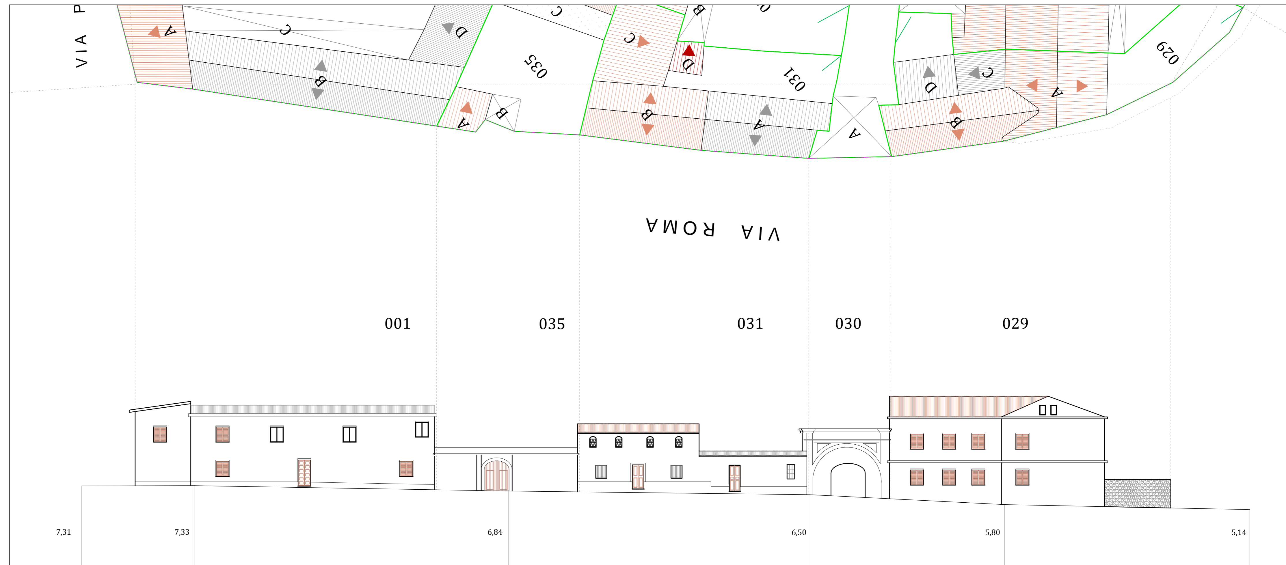
Via Roma ATTUALE