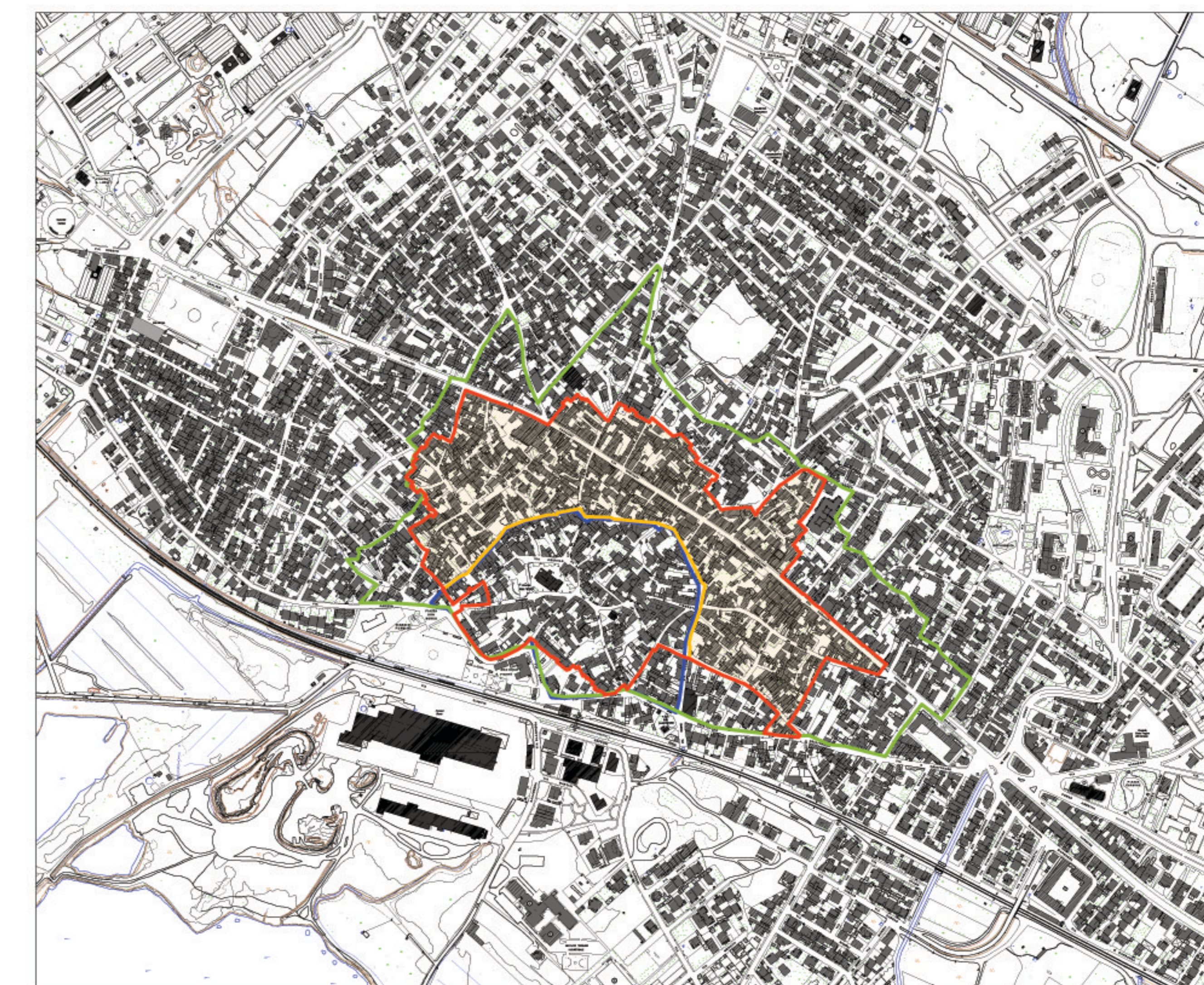
PLANIMETRIA SCALA 1:5000 PERIMETRO DEL CENTRO DI ANTICA FORMAZIONE COME DA ATTO RICOGNITIVO DETERMINAZIONE R.A.S. N°207/DG DEL 12 FEBBRAIO 2008